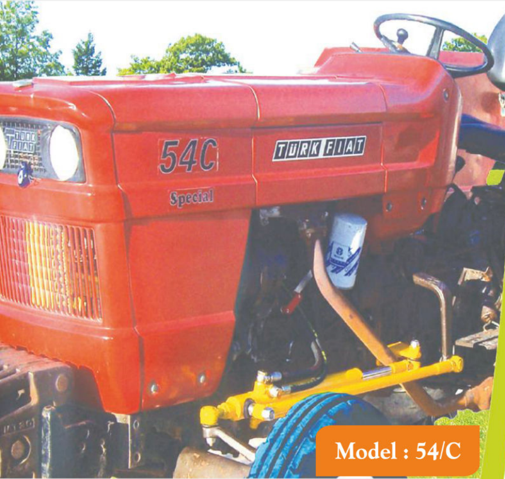
Model : 54/C